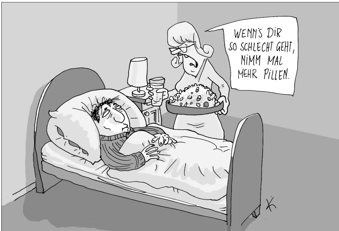
Cartoon: Matthias Kiefel